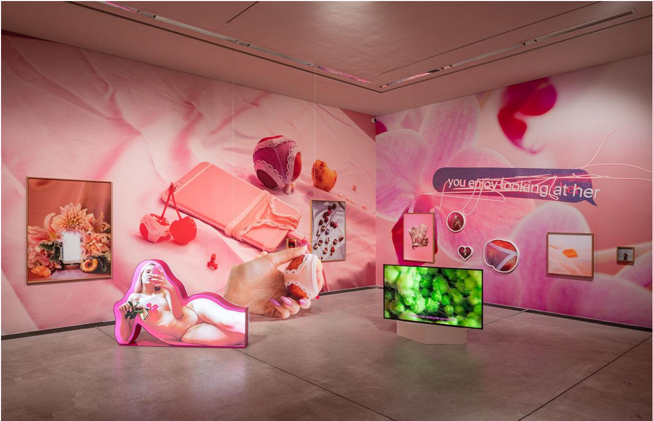
Arvida Byström, Cherry Picking, 2018. Courtesy kunstneren. Foto: David Stjernholm