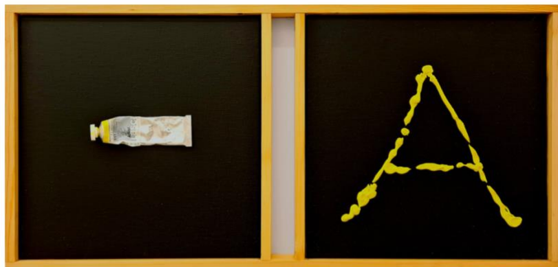
Poul Pedersen, fra "Det gule minus-plus alfabet (en mutation)", 2021