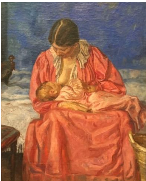
Johannes Larsen: 'Alhed ammer Puf', 1889. Johannes Larsen Museet.

Selv når Johannes Larsen i 1887 rent faktisk titulerer sin hustru og kunstnerkollega med fornavn i titlen 'Alhed ammer Puf', er der intet spor af hendes eget kunstneriske arbejde. I stedet er Alhed Larsen fremstillet i rødt og blå, som det er traditionen for den kristne Madonna.